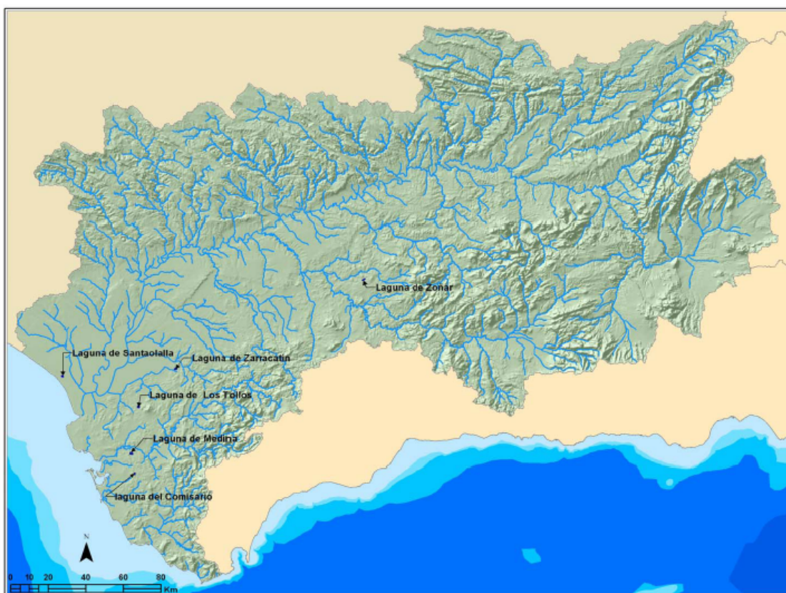
Figura 6. Masas de agua Lagos. DHG

La Laguna de Santa Olalla es la única representante de los lagos litorales, el resto son sistemas de interior en cuenca de sedimentación, de origen no cárstico, excepto Zóñar; de salinidad y hidroperíodo variables ( Figura 6 ).